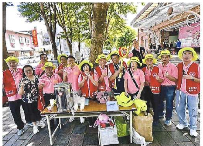
820 房仲日公益捐血 環島接力宣導活動