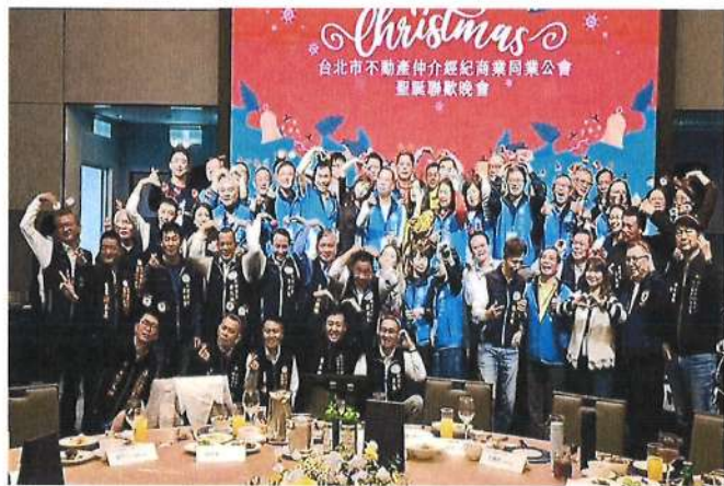
114.12.9 「客庄尋味樂～房仲更凝聚」北市仲介公會新竹自強活動 × 三縣市友會聯誼晚會