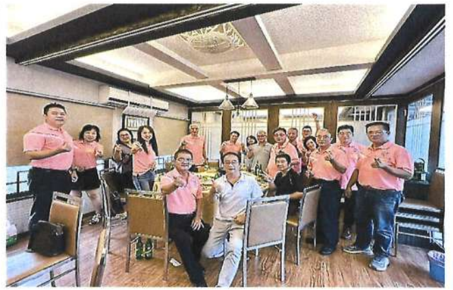
114. 7. 29 公會錄製防詐宣導餐敘