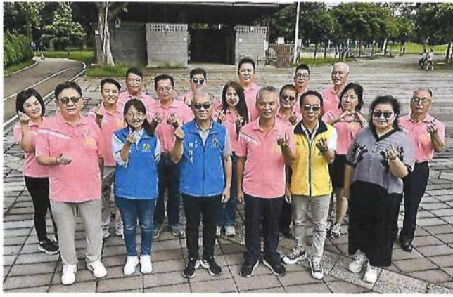
114. 7. 29 公會錄製防詐宣導