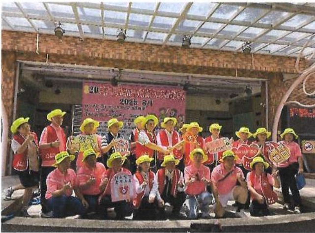
820 房仲日公益捐血 環島接力宣導活動