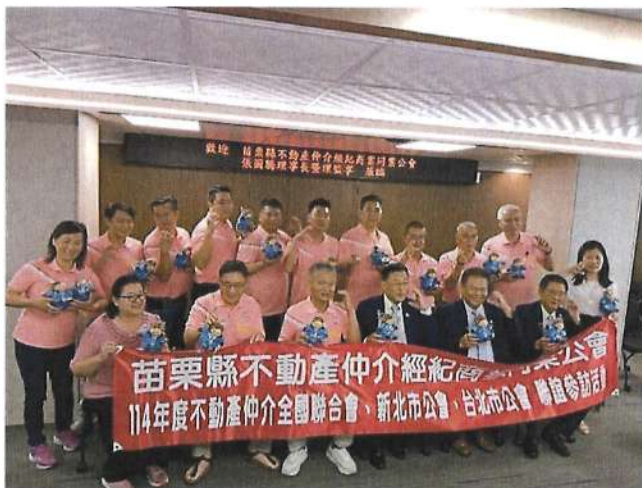
114. 6. 24 不動產仲介全國聯合會參訪