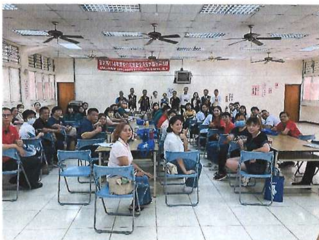
114. 7. 29 全民反詐宣導苑裡講座