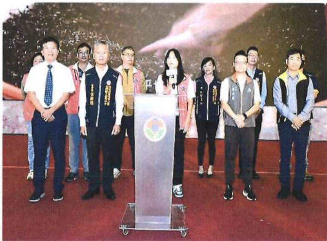
114.10.23 苗栗縣政府舉辦「114 年地政防詐影片首映會」