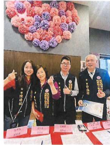
114.3.28 第十屆第二次會員大會暨春酒服務理監事