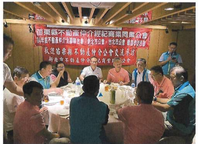
114. 6. 25 新北市公會參訪