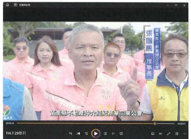
114. 7. 29 公會錄製防詐宣導短片