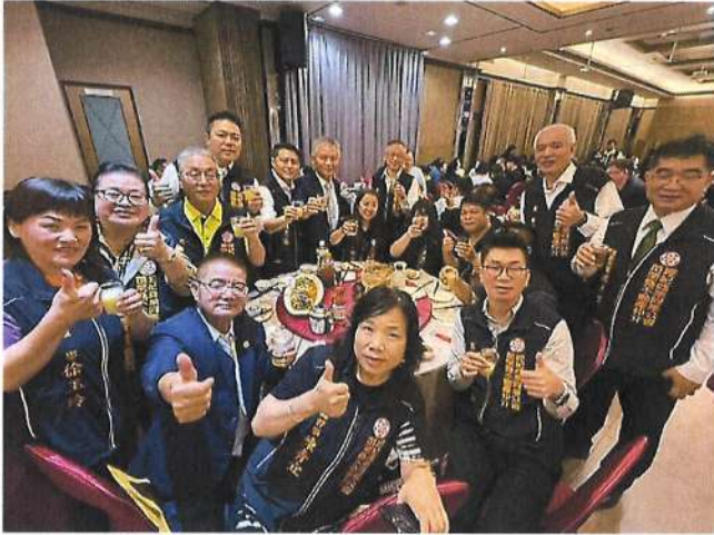
114.3.28 第十屆第二次會員大會暨春酒